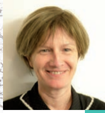
A. Bos 3