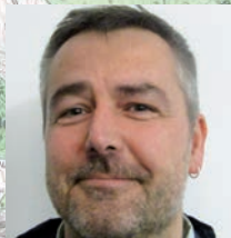
J.P. Remise 23