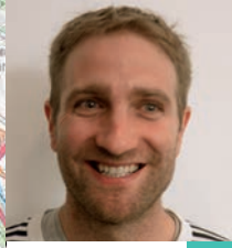
G. Soulié 28