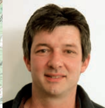
F. Latieule 17