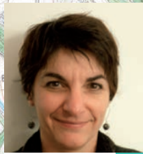
A. Bru 4