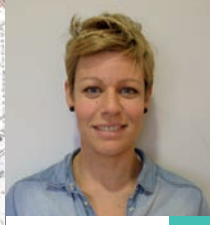
A. Soufli 27